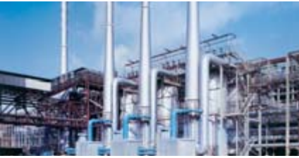
▲ Eine Salzschmelzeanlage mit total 88 MW Leistung bei 400 °C. Sie dient der Beheizung einer Bauxitaufschlussanlage in Deutschland.

Salzschmelzen als Wärmeträger eignen sich mit Temperaturen von bis zu 600 °C zur Wärmeübertragung bei unterschiedlichen chemischen Prozessen. Im Vordergrund stehen jedoch Anwendungen, bei denen auf hohem Temperaturniveau gearbeitet wird, beispielsweise bei der Melamin- oder Aluminiumoxidproduktion. Zum Einsatz gelangen Salzgemische mit einem Schmelzpunkt von 142 °C (im Neuzustand), die unter Betriebsbedingungen flüssig sind und drucklos betrieben werden.